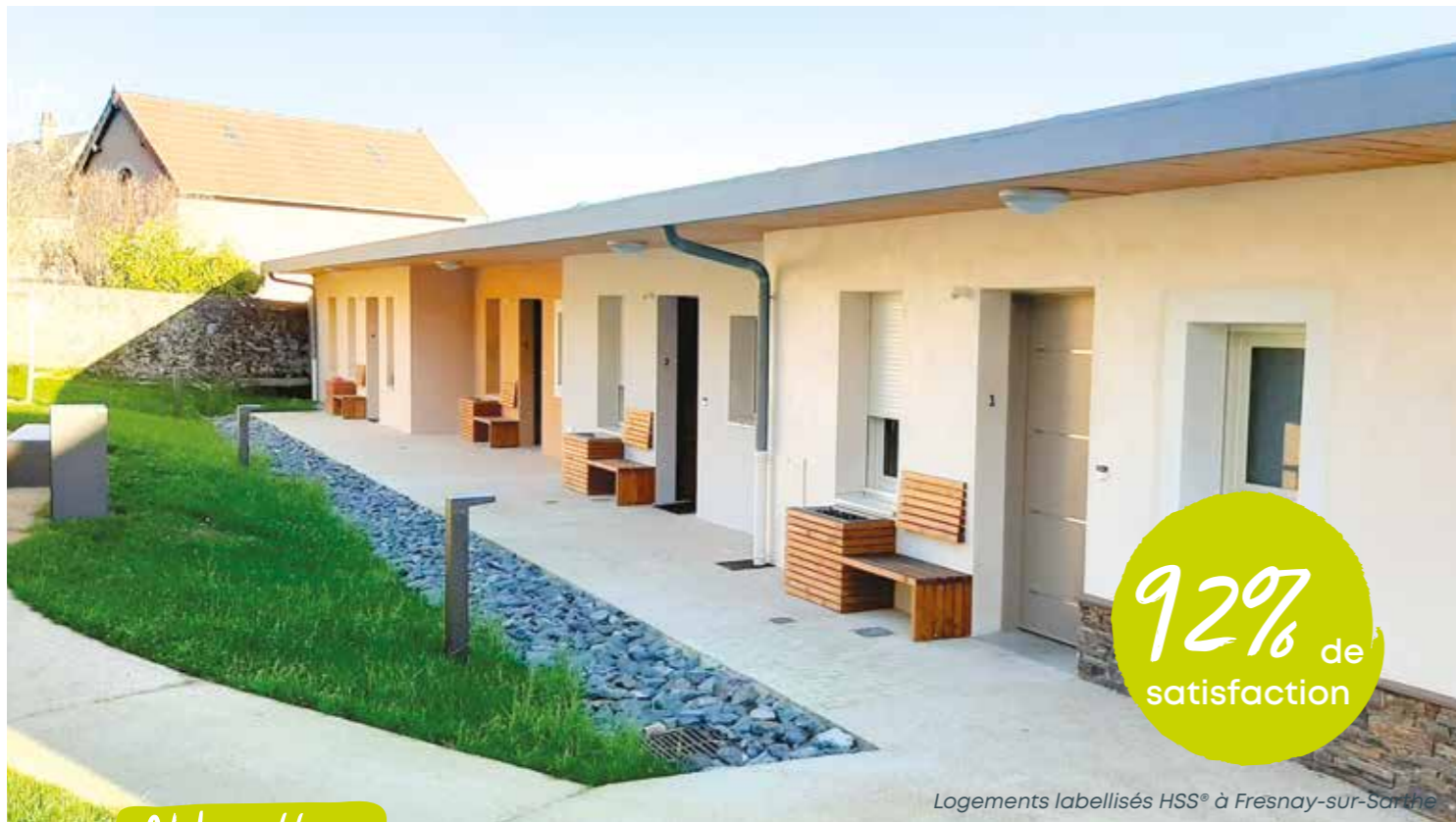
Logements labellisés HSS® à Fresnay-sur-Sarthe