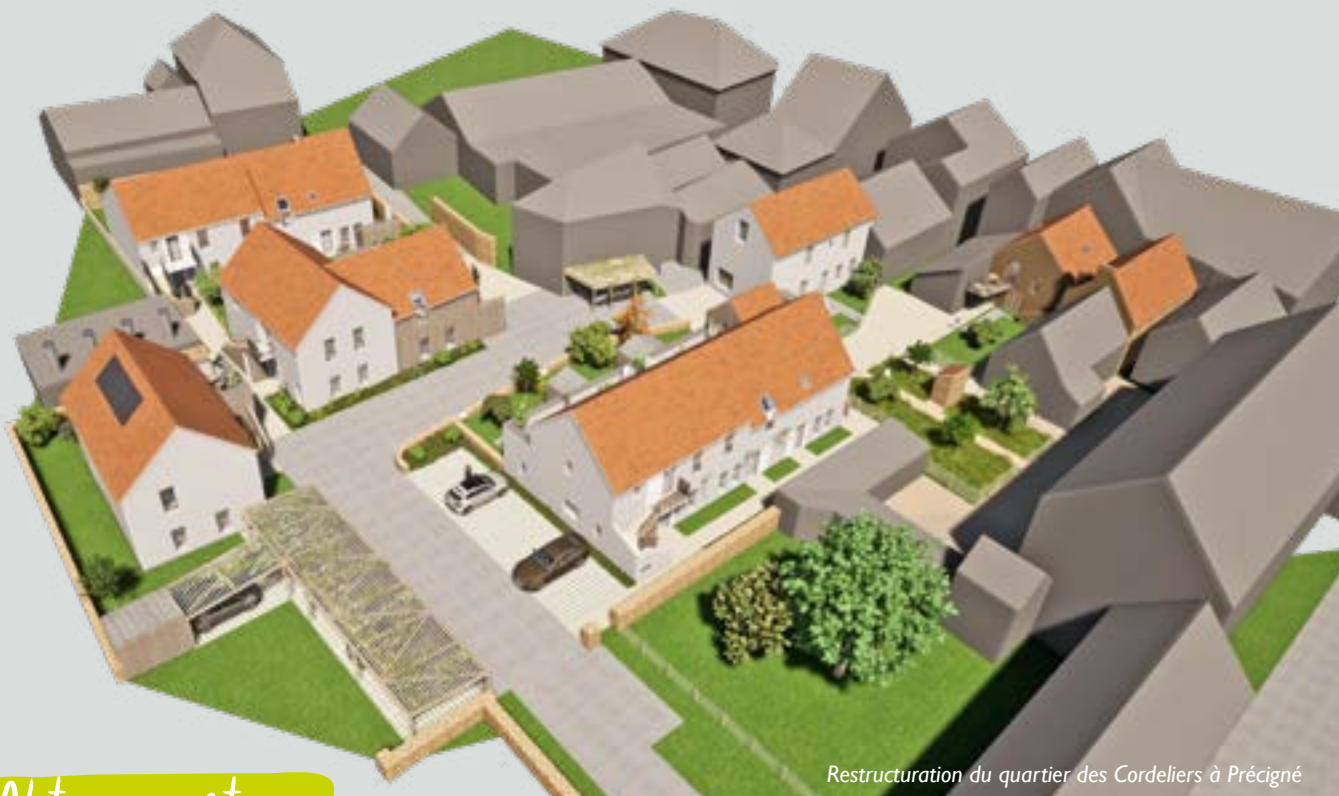
Restructuration du quartier des Cordeliers à Précigné