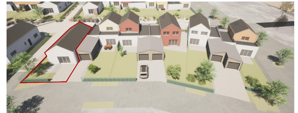
Vue générale côté jardin/rue