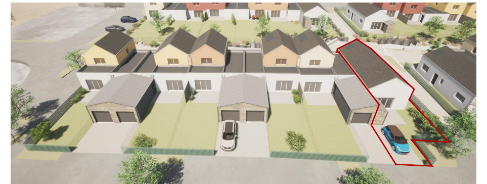
Vue générale côté jardin