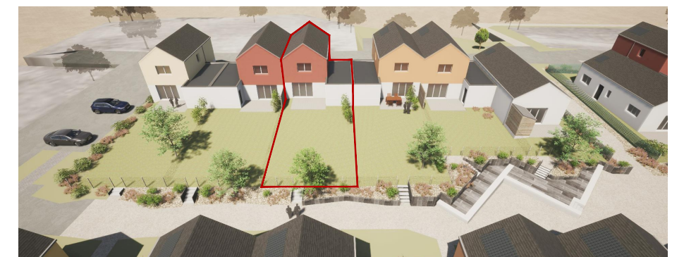
Vue générale côté jardin