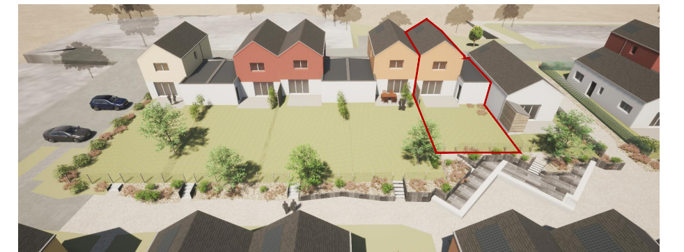
Vue générale côté jardin