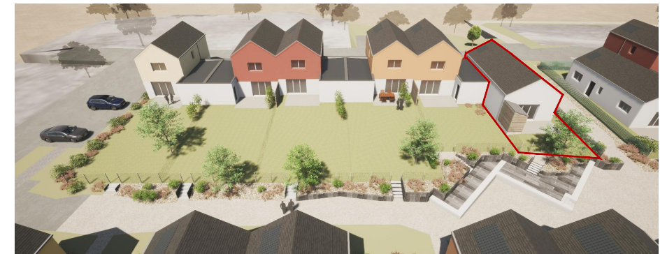
Vue générale côté jardin