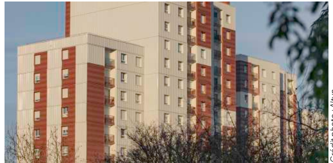
Une rénovation innovante au Mans grâce au programme Energiesprong

À venir en 2025 : 200 logements neufs répartis sur Sablé-sur-Sarthe, Allonnes, Notre-Dame-du-Pé, La Flèche, Mamers, Saint-Ouen-en-Belin, Malicorne, Montval-sur-Loir.