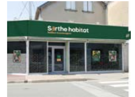
Ex : l'agence de Montval-sur-Loir

“ Retrouvez tous nos appels d'offre sur : sarthe-habitat/entreprises.fr