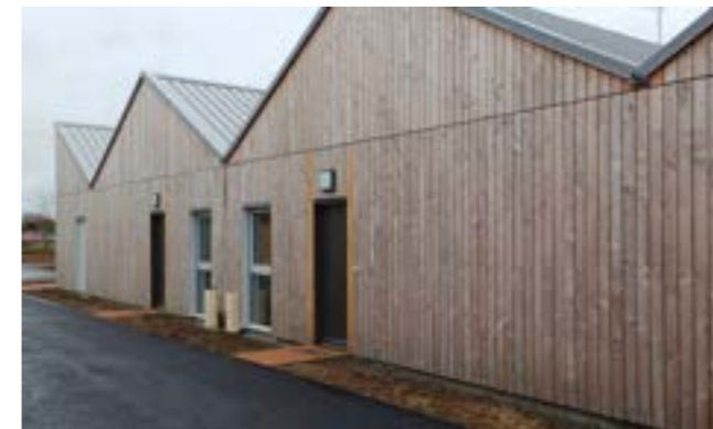
Malicorne : 12 logements neufs, inaugurés en mai 2025.

Pour plus d'informations, rendez-vous sur sarthe-habitat.fr