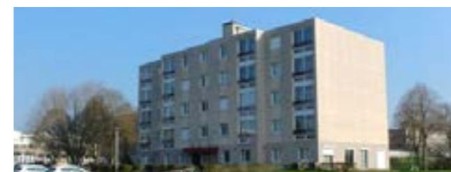
Sablé-sur-Sarthe : Ex-foyer La Piscine, 19 logements neufs, 22 logements réhabilités

Nous agissons aussi bien dans les grandes villes, avec des projets ambitieux de renouvellement urbain comme celui du cœur de ville d'Allonnes, que dans les petites communes, où chaque aménagement participe à renforcer l'attractivité locale. Notre ambition est claire : devenir un acteur incontournable pour l'évolution responsable de nos territoires, en conciliant développement, durabilité et bien-être des habitants.